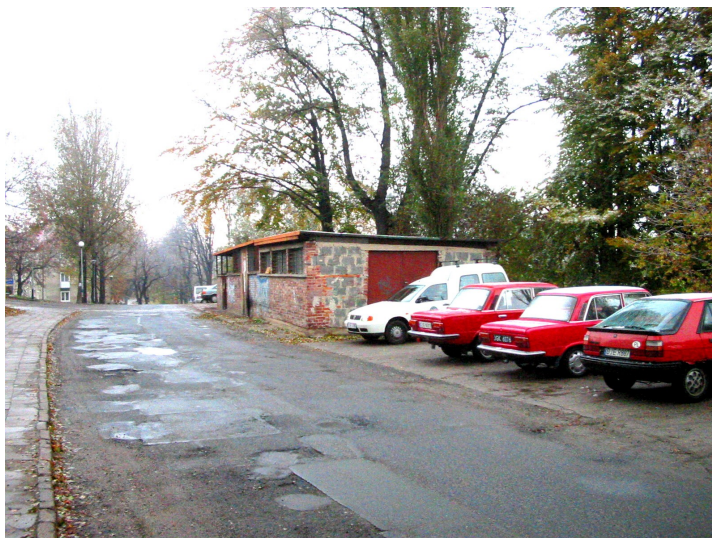
Fotografia 4 ul. Leśna

Jezdnia ograniczona jest krawężnikami betonowymi – znacznie zniszczonymi i popękanymi. Ulica posiada obustronne chodniki o szerokości 2,0 m i 2,50 m z betonu, który jest znacznie skorodowany i wyluszczony oraz płytek betonowych 35x35x5 znacznie zniszczonych i popękanych. Na skarpie w rejonie skrzyżowania z ulicą Św. Anny zlokalizowane są wyloty дренаżu terenu, które nie są włączone do kanalizacji deszczowej. Naprzeciw budynków mieszkalnych zlokalizowany jest plac postojowy dla samochodów o nawierzchni betonowej – znacznie zniszczonej. Część placu zajęta jest przez boksy na śmieci dla osiedla mieszkaniowego. Stan ulicy przedstawia dokumentacja fotograficzna